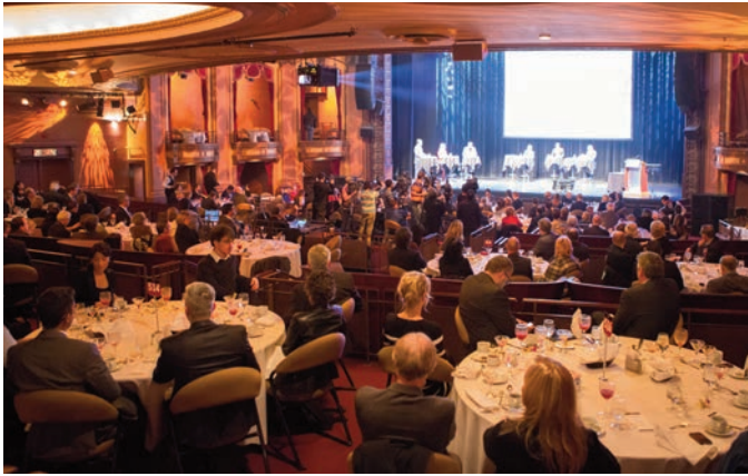
Débat électoral municipal - 21 octobre 2013