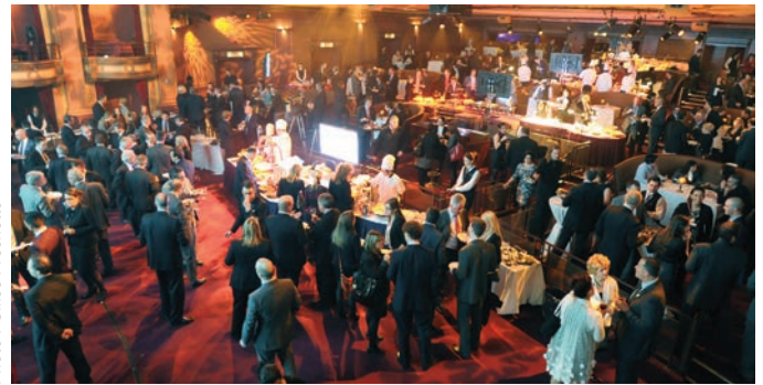
Trophées Vision - 20 novembre 2013