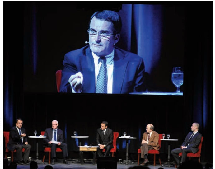
Québec 2014 : Perspectives économiques et politiques - 14 janvier 2014