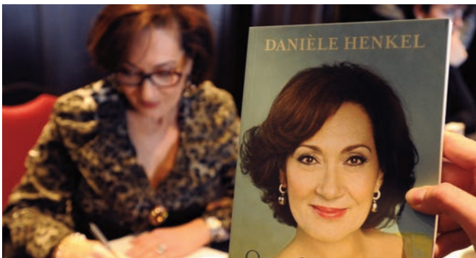
Déjeuner-causerie - 17 décembre 2013