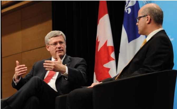
Déjeuner conférence avec l'Honorable Stephen Harper - 6 février 2014