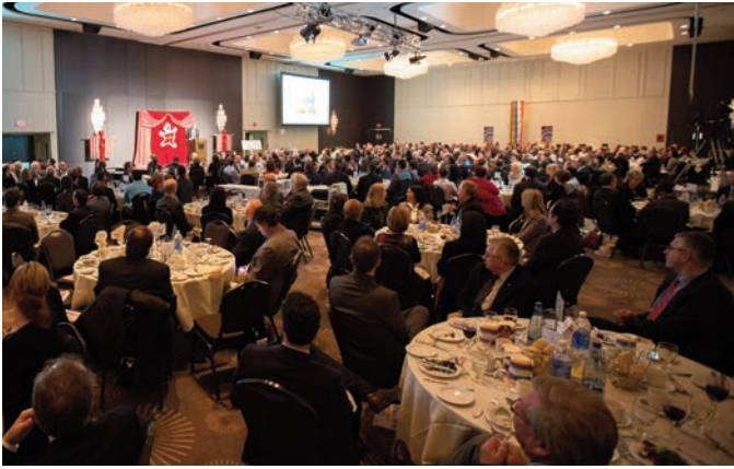
Déjeuner des chefs d'entreprise du Carnaval de Québec - 28 janvier 2014