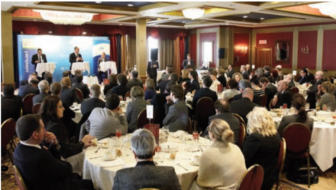
Débat électoral provincial - 25 mars 2014