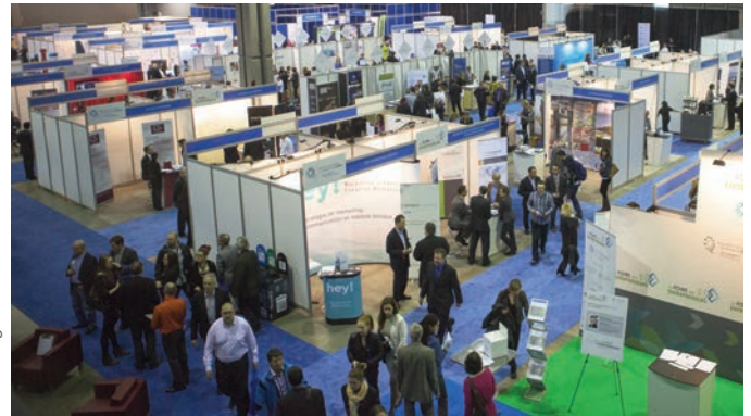
Foire des entrepreneurs - 1 er mai 2014