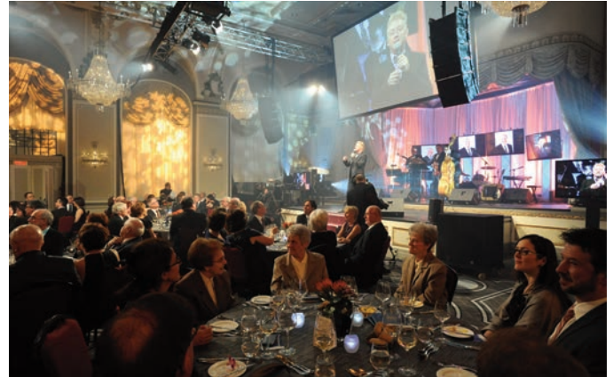
Les Grands Québécois - 4 avril 2014