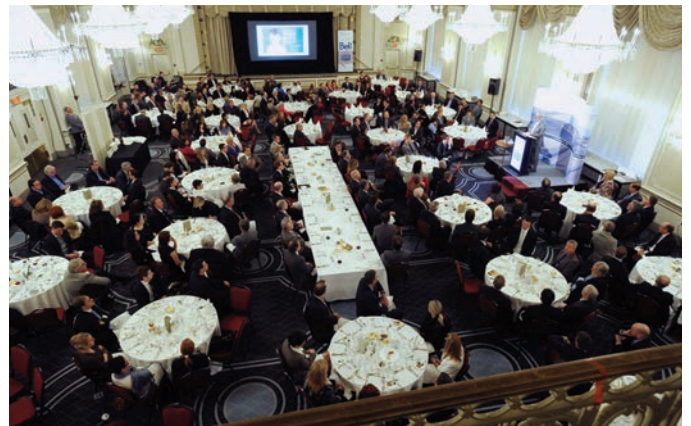
Déjeuner-causerie - 12 mai 2014