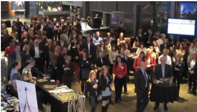
Soirée découvertes d'automne - 14 novembre 2013